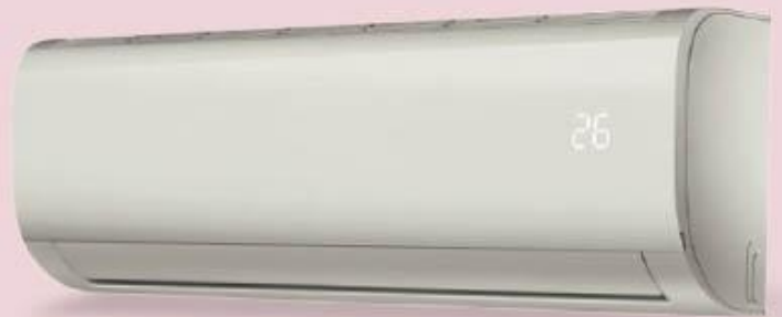
AIRE ACONDICIONADO FRIO / CALOR