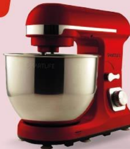
BATIDORA CON BOWL