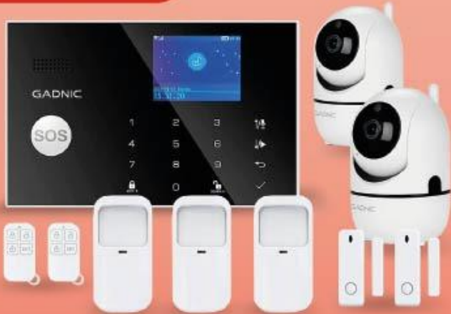
KIT ALARMAS DOMICILIARIAS / COMERCIALES