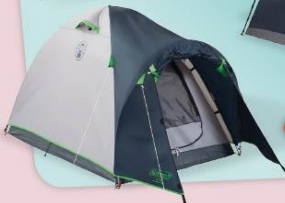
CARPA 4 PERSONAS