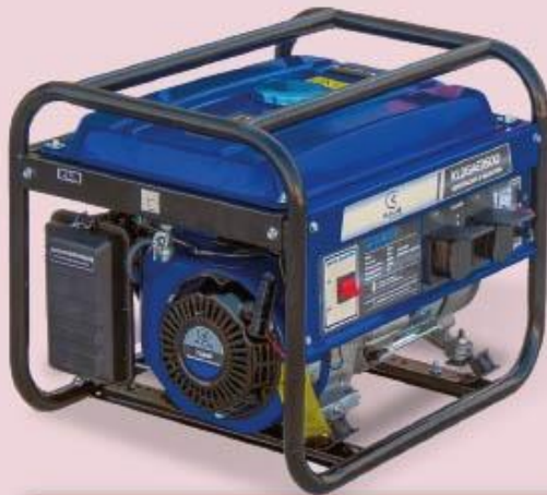
GENERADOR ELÉCTRICO (VARIAS POTENCIAS Y MARCAS)