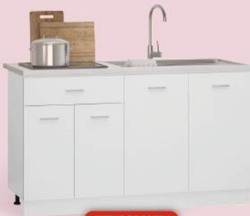
MUEBLE DE COCINA