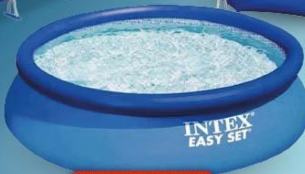
PILETA CON ANILLO INFLABLE