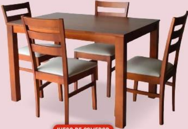
JUEGO DE COMEDOR