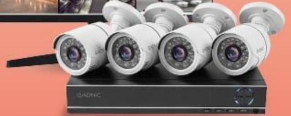
KIT CÁMARAS DE SEGURIDAD