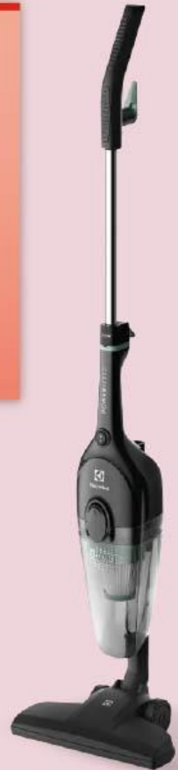
ASPIRADORA SIN BOLSA