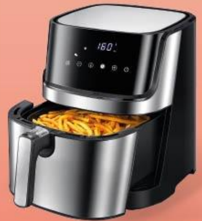
FREIDORA DE AIRE