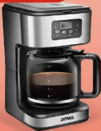
CAFETERA DE FILTRO